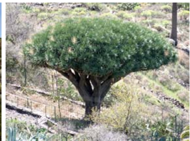
La Gomeras enda drakblods-träd!

På vår väg tillbaka från La Gomera fick vi känna på de starka vindarna utanför ön som vi klarat oss från på ditvägen. Väderprognosen sa NO ca 7 m/s men vi hann inte mer än utanför hamnpiren förrän vi hade N 17 m/s och en sjö som bara växte. Dessutom var det en ganska kraftig nordgående ström. Fort gick det i alla fall och 1 timma och 7 Nm senare var det över, på bara några minuter gick vinden ner till NV 5 m/s och sjön blev behaglig. Något senare fick vi t o m starta motorn och gick åter till Marina del Sur/Las Galletas.