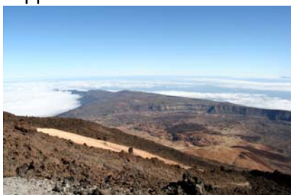
Vy ovan molnen

Teide, ja! Turen går genom en 16 km vid krater som bildades då en jättevulkan, för ca tre miljoner år sedan, fick ett utbrott. Vid norra kanten av denna krater ligger Teide, som är en mycket mindre vulkan. Vi åkte upp en dag då det var molnigt nere vid stranden och hamnade ovanför molnen i så klar och blå luft att man nästan fick nypa sig i armen för att fatta att det var sant. Otroligt vackert där färden gick genom detta ödsliga landskap med lavaströmmar, sandslätter och gnistrande klippor. En del klippor var alldeles blågröna av koppar.