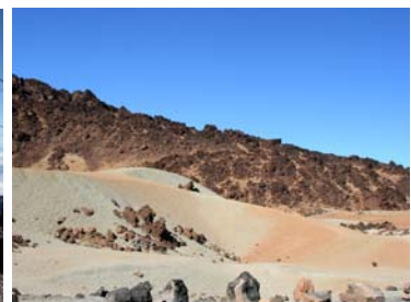
Sandslätter i massa färger