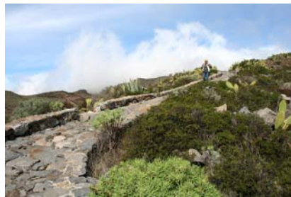
Anlagd stenstig längs ravinen ledde till