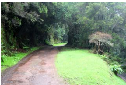
I nationalparken Garajoney

ner på berget åter gick/klättrade nedför en ravinkant för att titta på öns enda drakblods-träd. Dessa härstammar från Kanarieöarna, men är numera mycket sällsynta i vilt tillstånd. Här hade temperaturen klättrat upp till 12 grader, och med solen i ansiktet kändes det som en vårdag då de första solstrålarna värmer så skönt så fram åkte kaffe och macka. Till kvällen fortsatte vi i höstens tecken och gjorde slut på våra sista torkade kantareller. Efterrätt på friterad camembert med hjortronsylt gick i samma anda.