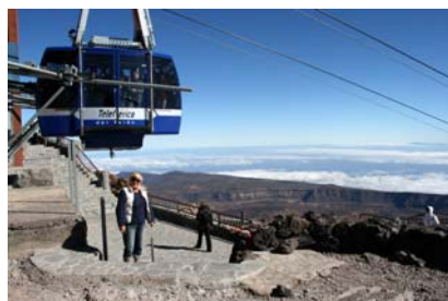
Linbana till Teides topp